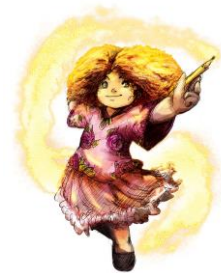
FAMILI TOP® Claveisolles © Hugo Tartaix Le secret du coffre d'argent, personnage de Pastelle