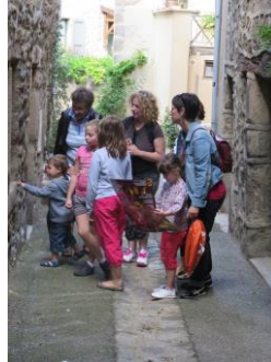
FAMILI TOP® Mornant