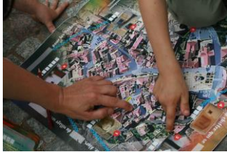
FAMILI TOP® Bois d'Oingt Plan du village

Visuels en haute définition disponibles sur demande