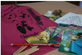
FAMILI TOP® Claveisolles Sac FAMILI tOp®