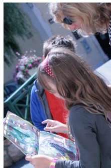
FAMILI TOP® Condrieu