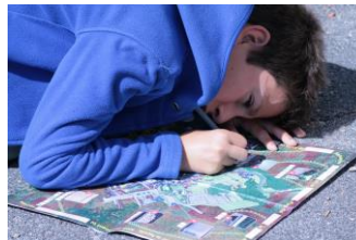
FAMILI TOP® Condrieu